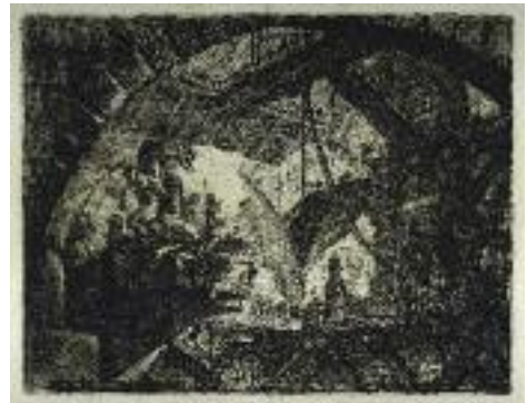
Giovanni Battista Piranesi: Reos sobre plataforma suspendida (Cárcel), c. 1761. Fondazione Giorgio Cini, Venecia.