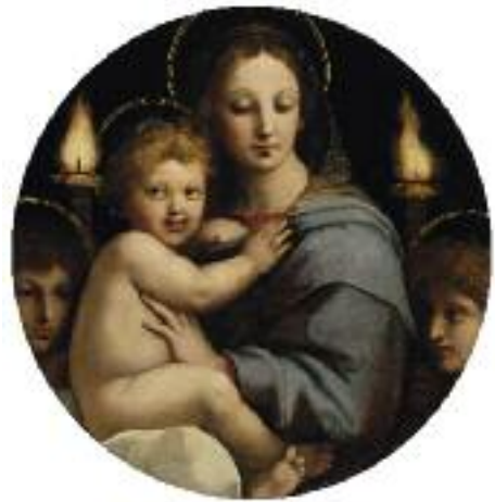
Rafael y taller: La Virgen de los candelabros, c. 1513-14. Óleo sobre tabla, 65,7 x 64 x 1,9 cm (sin engatillado). ø 65,8 cm. The Walters Art Museum, Baltimore. Henry Walters.

Pero queda todavía, antes de despedirnos, una última novedad a destacar. En la remodelación en curso de la sección de libros, incorporamos desde ahora un nuevo apartado, dedicado al libro de artista, y que nace de hecho enlazando dos nombres estelares del panorama histórico de la poesía experimental española.