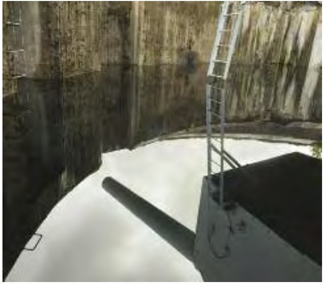
Per Barclay: Adolf Gun, Harstad (IX), 2009. Trondenes Fort, Harstad. Instalación con aceite de motor; impresión lambda, 180 x 205 cm.

neas funcionaban muy bien como fotografías por sí mismas. Empieza desde entonces a desarrollar estos montajes con el único fin de capturar una imagen final sobria, envolvente y recóndita, casi oculta. Solo en una ocasión un motivo ha dominado la imagen, un sillón de partos del hospital de Thiers, a pocos kilómetros de Lyon ( Gynecological Ward , 1991). En el resto, todo aparece despejado, nada interfiere la extensión del piso. El trabajo evoluciona, los espacios se hacen cada vez