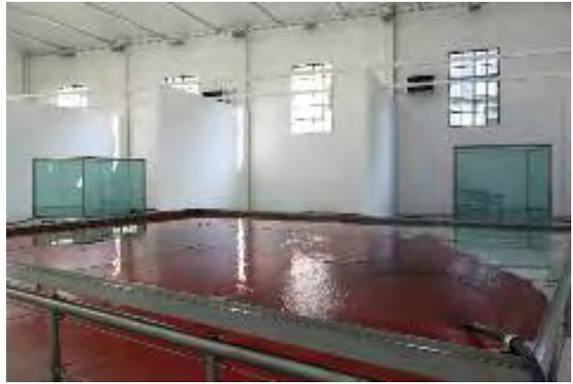
Per Barclay: Rosso Ribera, 2003/11. Acero y tanque de cristal, 600 x 450 x 75 cm. Hierro, acero y tanques de cristal reflectante, 180 x 250 x 200 cm. Tubos de plástico, agua, pigmento, sistema hidráulico. Galería Giorgio Persano, Turín, 2011.

aspectos meramente estéticos. De hecho, cuando recurre al vino lo hace en zonas donde este caldo es tradición, emblema gastronómico y uno de los sustentos principales de la economía de la región. “Utilicé vino en una hermosa capilla de Chinon, en Francia, que es famosa por sus tintos ( The Chapel of Sainte Radegonde , 2006). Pensé que el vino en la capilla encajaba bastante bien. El vino es la sangre de Cristo” 2 . Con anterioridad, ya había