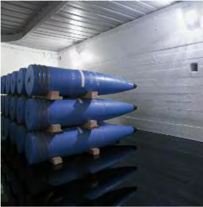
Per Barclay: Adolf Gun, Harstad (I), 2009. Trondenes Fort, Harstad. Instalación con aceite de motor; impresión lambda, 170 x 170 cm.