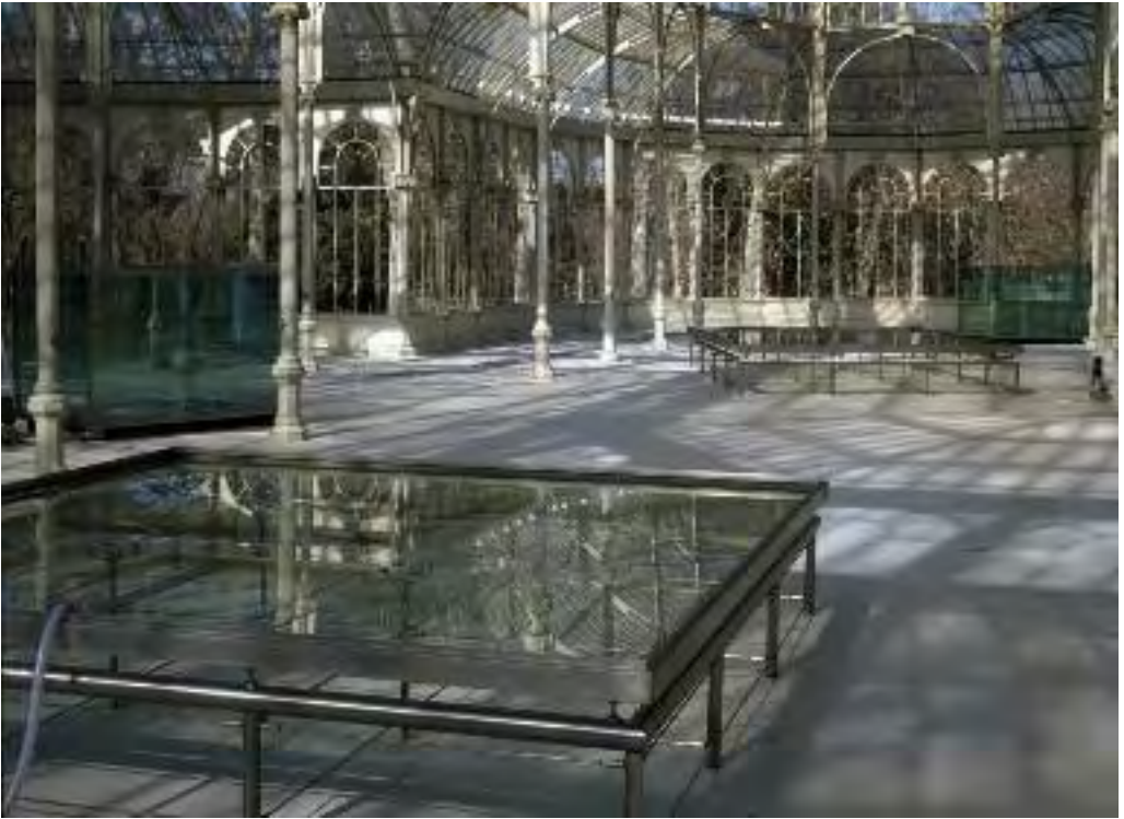
Per Barclay: S/T, 2003. Acero y tanques de cristal, 450 x 450 x 75 cm; 600 x 450 x 75 cm. Hierro, acero y tanques de cristal reflectante, 180 x 250 x 200 cm. Tubos de plástico, agua, sistema hidráulico. Palacio de Cristal, Museo Nacional Centro de Arte Reina Sofía, Madrid, 2003.

acero y cristal y tres “jaulas” transparentes con los mismos materiales. Pero a la hora de llenarlas, problemas técnicos de última hora le obligaron a minimizar los riesgos de fugas sustituyendo el líquido rojo por agua” 5 .