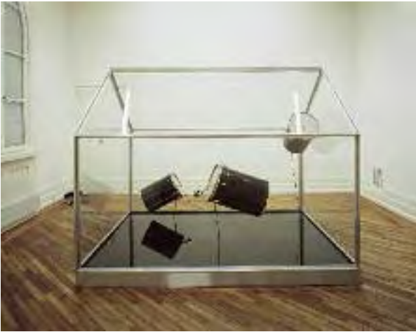
Per Barclay: S/T, 1993. Estructura de aluminio, aceite de motor, batería, motores, temporizador, acero y madera, 200 x 185 x 250 cm. Museet for Samtidskunst, Oslo, 1998.

La atracción misteriosa que produce cualquier superficie especular, es un motivo que ha fascinado al hombre desde siempre. Esa imagen inalcanzable que se refleja a semejanza del original y se ubica en una dimensión inexplicable, ha funcionado en muchos casos como eje semántico para elucubrar sobre las posibilidades meta-textuales de la realidad. En El Aleph , Borges se refiere al espejo como “el infinito espacio”, un lugar indeterminado y mágico que en algunos cuentos infantiles como Alicia a través del