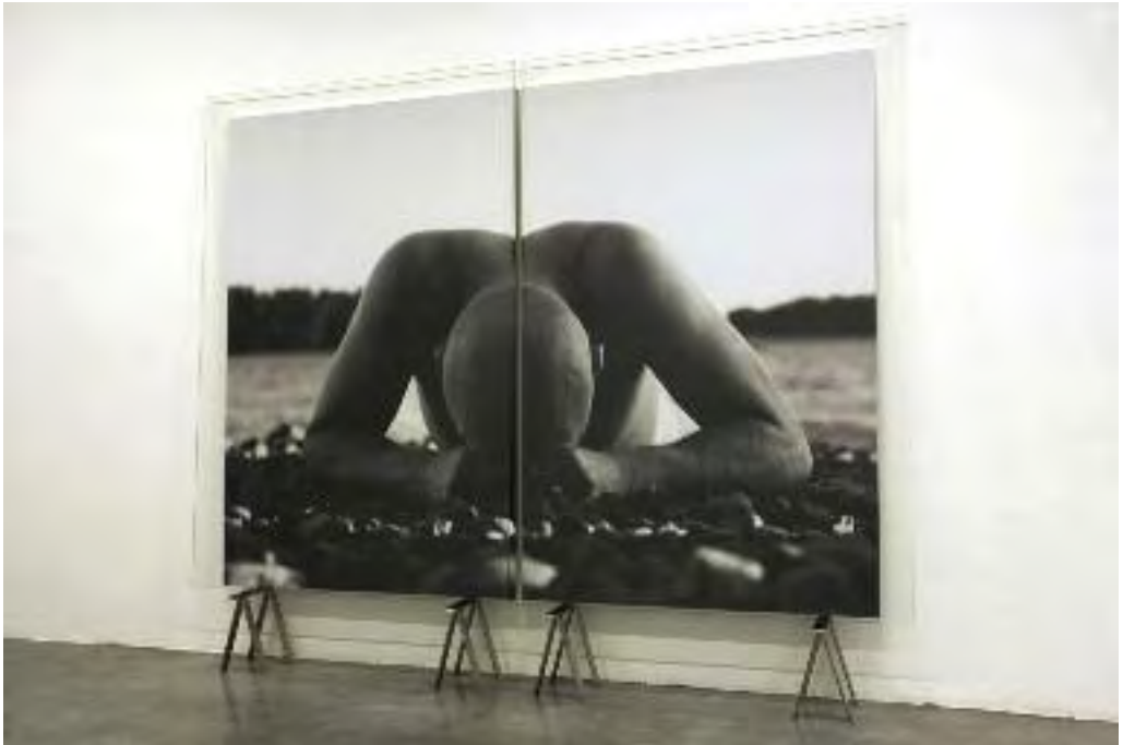
Per Barclay: Simen, 2005. Impresión lambda en blanco y negro, paneles de vidrio, 188 x 250 x 25 cm. Galería Oliva Arauna, Madrid, 2006.

e inaccesibles, aunque dos de los emplazamientos que sueña con poder intervenir en el futuro son públicos y muy conocidos: el Museo del Prado en Madrid y el Panteón de Agripa en Roma. Pese a que los líquidos que utiliza actualmente en su mayoría son sucedáneos tintados, sigue queriendo llevar a cabo una instalación con mercurio, lo que ocurre es que para poder materializarla se enfrenta a varios inconvenientes de peso: resulta un producto extremadamente costoso, es difícil de manipular y, sobre todo, al ser muy tóxico supone un gran riesgo para el medio y las personas.