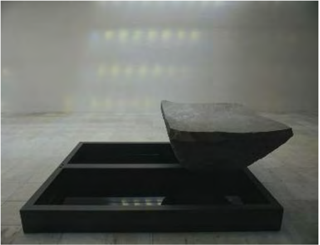
Per Barclay: S/T, 1990. Acero, aceite de motor, 30 x 240 x 300 cm. Piedra volcánica, 90 x 180 x 150 cm. Instalación en el Pabellón de los Países Nórdicos, Bienal de Venecia, 1990.

gen y también, naturalmente, crear una sensación de vértigo. Me seduce la fuerza que desprende aquí la impresión de sentirse como al borde de un abismo, y decidí permitir, por primera vez, a los visitantes caminar alrededor de la instalación” 77 .