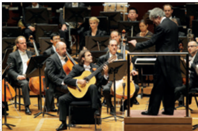
“He dado conciertos en más de ochenta países y durante años he tocado más fuera que en casa”, indica el guitarrista, en la imagen con la Malaysian Philharmonic Orchestra.

de compositores e intérpretes es interminable: desde los vihuelistas, pasando por Sanz y Guerau, Aguado, Sor, Tárrega, Segovia... Y sin olvidar claro, al gran constructor Antonio de Torres. Son tantos los nombres y tantas las músicas que casi merecería que se creara un Ministerio de la Guitarra para que se ocupara de su promoción y difusión. Debería existir un Museo Nacional de la Guitarra y sobre todo es necesario que forme parte habitual de las programaciones de las salas de concierto y de nuestras orquestas, al margen de los festivales específicos.