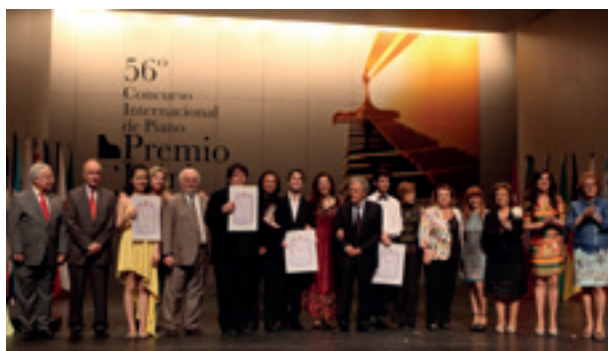
Premiados, jurado y autoridades en la entrega de premios.