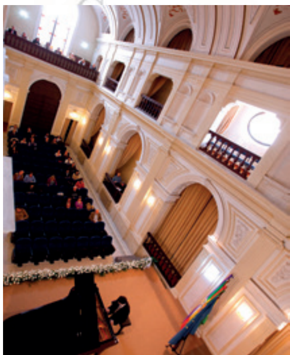
Una vista del paraninfo del Conservatorio Superior de Música de Jaén.