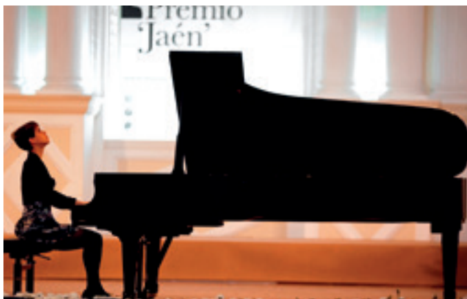
Parainfo del Conservatorio, sede de la primera prueba.