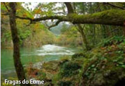
Fragas do Eume