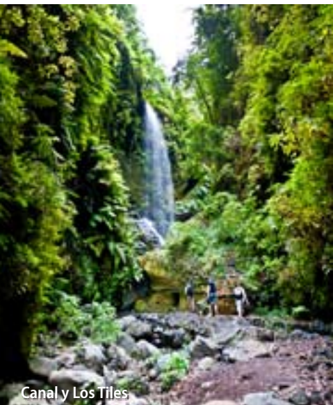
Canal y Los Tiles