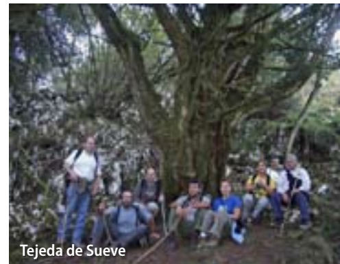
Tejeda de Suevo