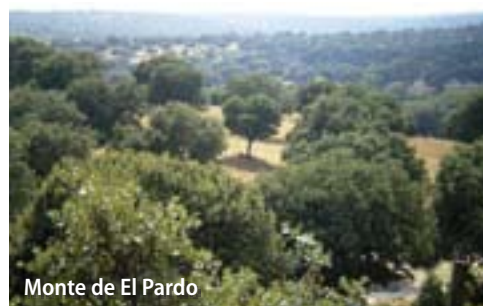
Monte de El Pardo