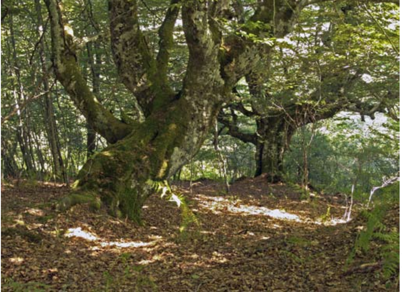
Bosque de Peloño (Ponga)