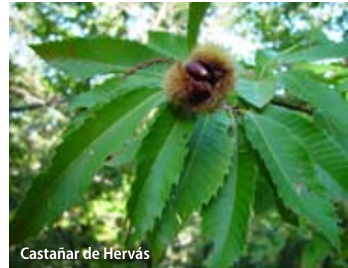
Castañar de Hervás