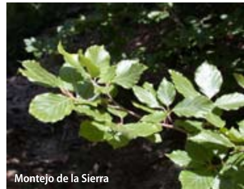
Montejo de la Sierra