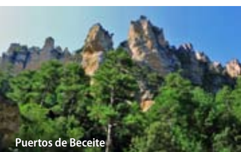
Puertos de Beceite

► Los Alcornocales y la Sierra del Aljibe (Cádiz y Málaga): Es el bosque mediterráneo más extenso y mejor conservado. Sus 170.025 ha, que se extienden por 16 municipios, han sido declaradas Parque Natural.