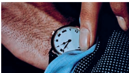
CHRISTIAN MARCLAY The Clock . Corderie dell'Arsenale