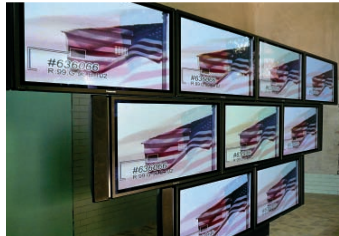
STURTEVANT Elastic Tango. Arsenale.