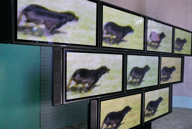
STURTEVANT Elastic Tango . Arsenale.