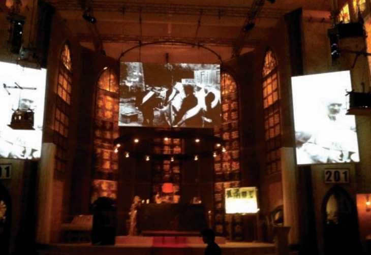
CHRISTOPH SCHLINGENSIEF. Pabellón de Alemania.