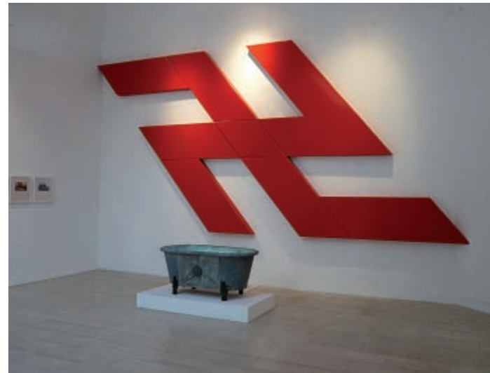
RAŠA TODOSIJEVIC Light and darkness of symbols. Serbian Pavilion.