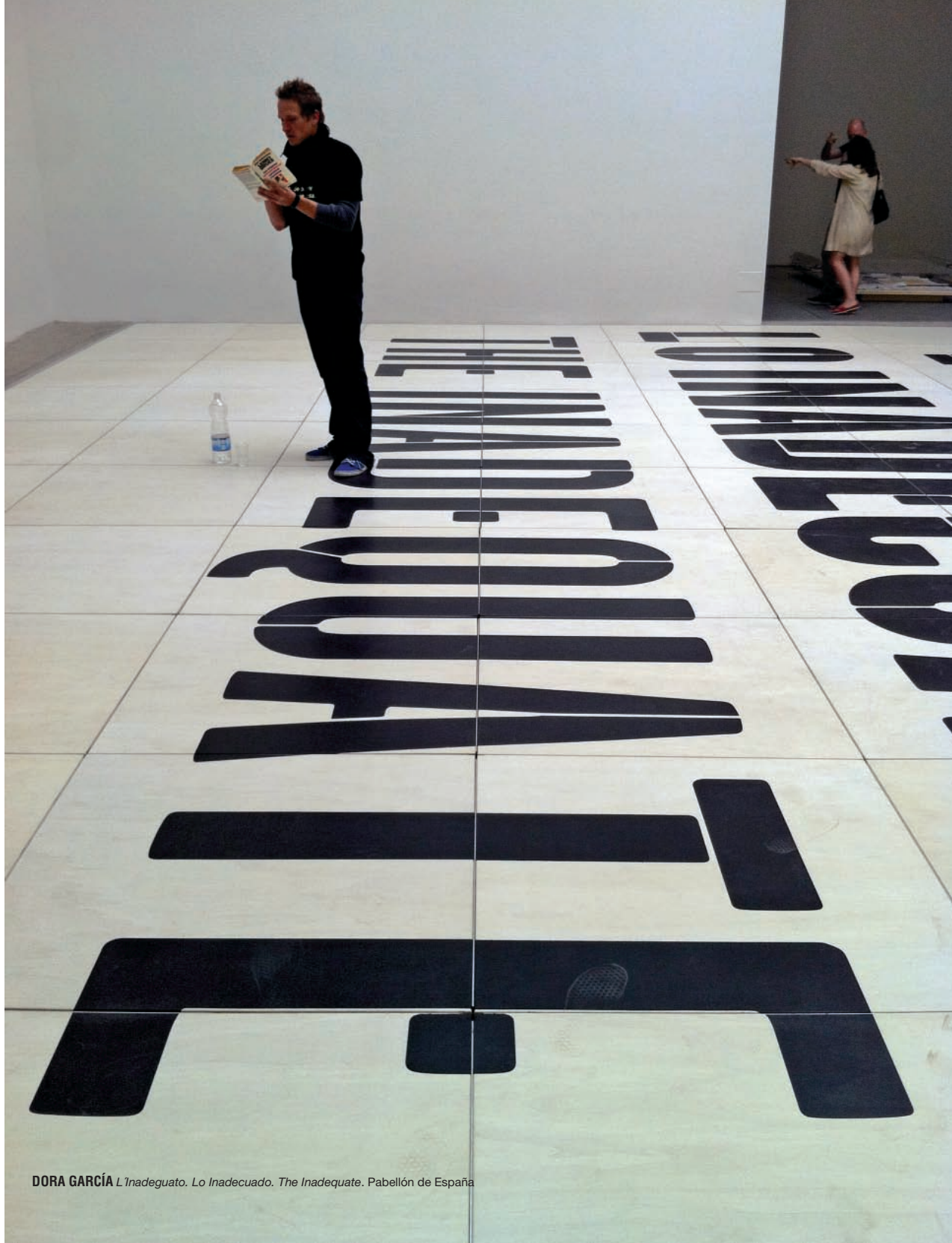
DORA GARCÍA Lo Inadecuado. Lo Inadecuado. The Inadequate. Pabellón de España