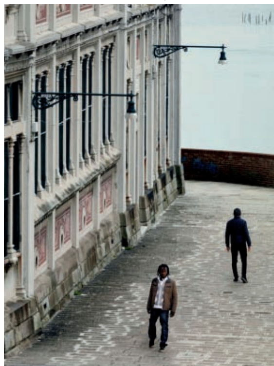
MABEL PALACÍN 180° . Pabellón de Cataluña y las Islas Baleares.