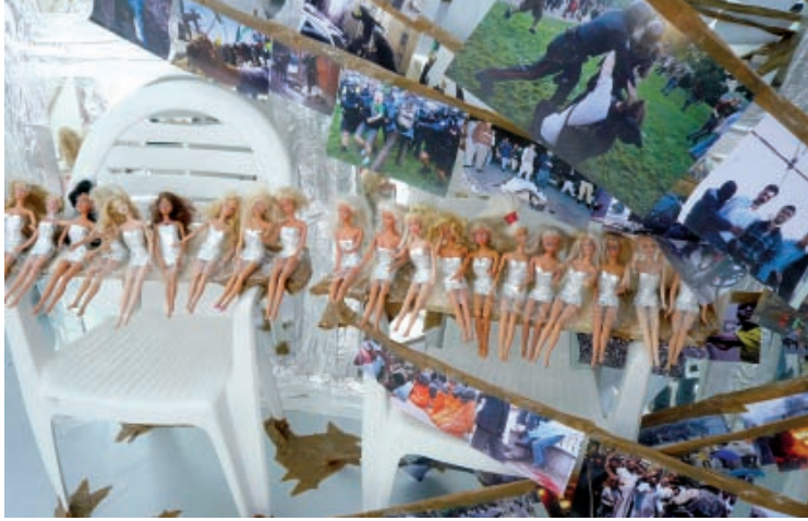
THOMAS HIRSCHHORN. Swiss Pavilion.