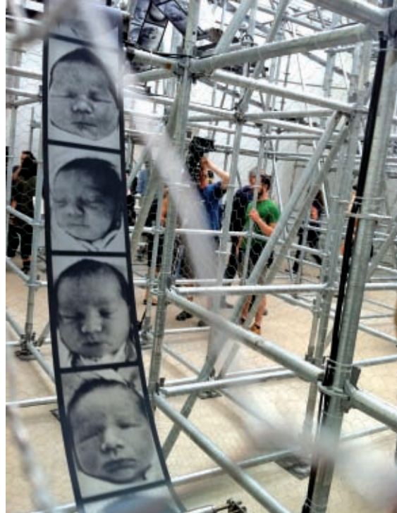
CHRISTIAN BOLTANSKI Chance . Pabellón de Francia.

Uno de los momentos fuertes de esta Bienal se sitúa en el Pabellón de Brasil que propone a una figura atípica; un artista tan relevante como minoritario a pesar de la trascendencia del conjunto de su obra como es Artur Barrio, galardonado en nuestro país con el Premio Velázquez 2011 (ver artículo en páginas contiguas).