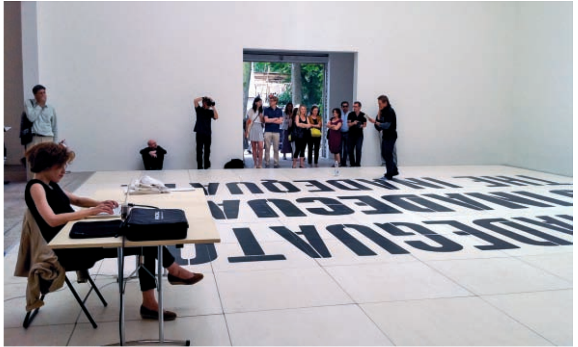
DORA GARCÍA L'Inadecuato. Lo Inadecuado. The Inadequate. Pabellón de España